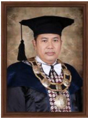
Wakil Rektor Bidang Kemahasiswaan dan Alumni